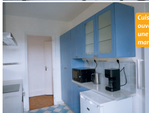
Cuisine ouverte sur une salle à manger.