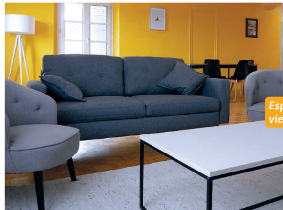
Espace de vie partagé.