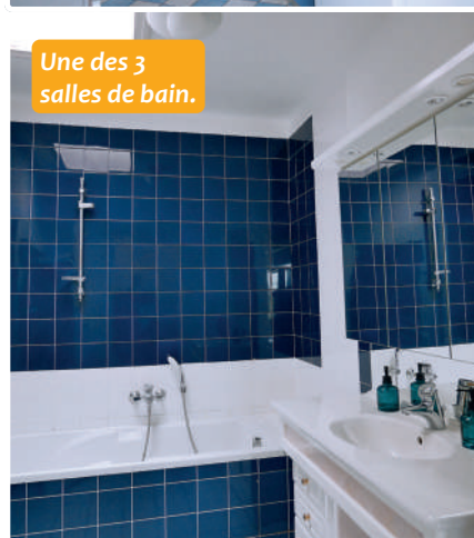
Une des 3 salles de bain.